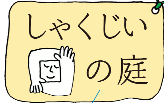
の大切にしている事。